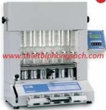
Thiết bị trích ly chất béo