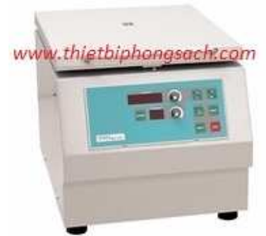
Máy li tâm điện tử