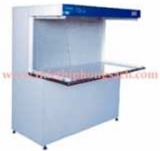
Non-electrostatic clean bench