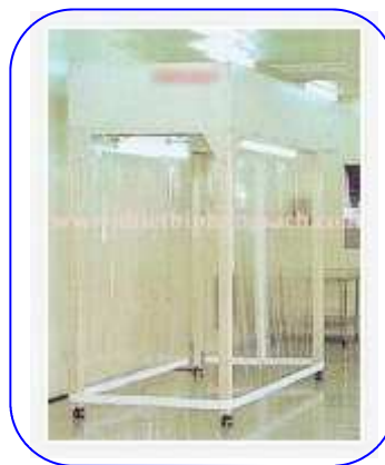
Phòng để quần áo sạch