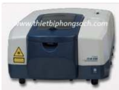
Máy đo độ phát quang Awareness Lumistat