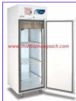
Tủ bảo quản máu