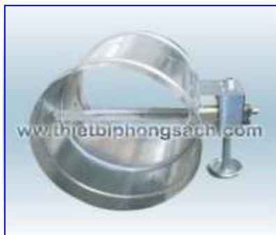
Round type air control valve