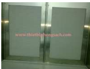
HEPA filter unit