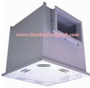
Lọc Hepa với luồng khí xoay vòng