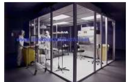
Phòng sạch Micro clean