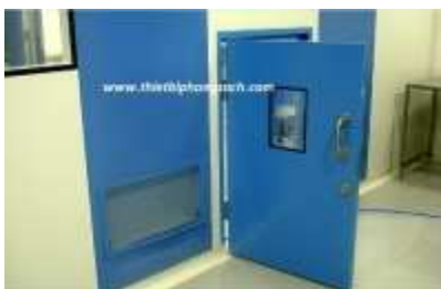
Cửa tiêu âm