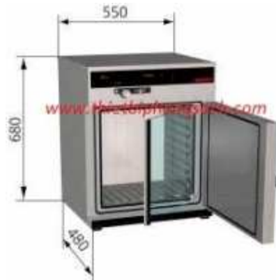
Tủ sấy memmert