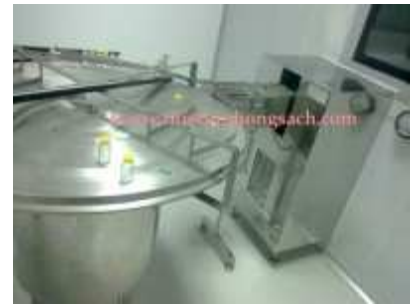
Băng truyền phòng thuốc