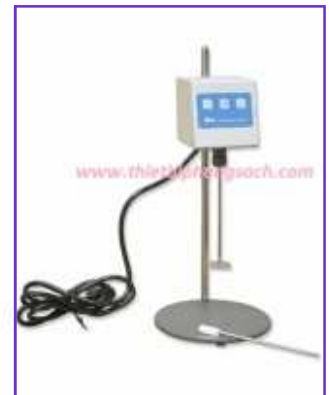
Máy khuấy đĩa