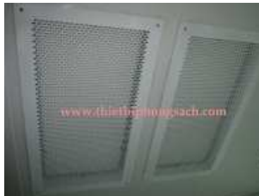
Lọc HEPA có thể tháo rời