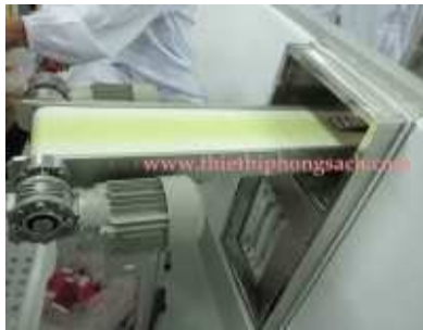
Air-lock băng tải