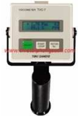
Máy đo độ nhớt