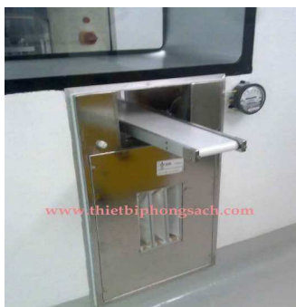
Băng tải phòng sạch

tải là một buồng thổi khí được đặt tại lối ra của băng tải nhằm không cho khí của 2 phòng trao đổi với nhau. Mục đích là không cho vùng khí nhiễm khuẩn của 2 vùng trao đổi với nhau. Gió hút ở chân Air - lock băng tải trong vùng E, qua lọc bụi túi vải F9 và Hepa H13 rồi thổi ra 2 hướng theo giàn lỗ từ dưới lên. Khi đó sẽ được tràn đều qua 2 vùng E và vùng D.