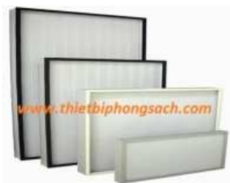
Mini-pleated Hepa lọc