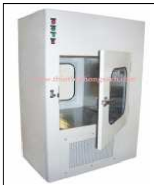
Pass box of air shower