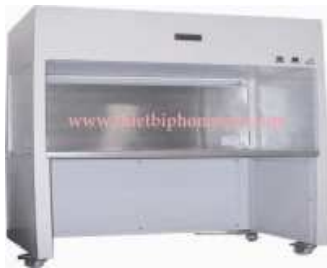
Vertical non-electrostatic clean bench