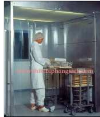
Buồng cân nguyên liệu

■ Scanbur Laminar Airflow Cabin kết hợp điều kiện làm việc với bảo vệ an toàn cho nhân viên và môi trường. Bên trong Laminar Air flow Cabin tất cả không khí có chứa các hạt, chất gây dị ứng và tác nhân gây bệnh sẽ bị đẩy xuống bởi thiết kế đồng phục độc đáo của chúng tôi Laminar Air flow. Bộ phận lọc không khí của HEPA sau đó chiết xuất thông qua tiền-lọc ở mặt sàn.