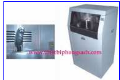
Máy rửa tay

Máy rửa tay có thể đặt ở lối vào phòng sạch hoặc đặt trong phòng sinh học, phòng thí nghiệm. Các loại ống gió, cửa gió, van áp suất, cửa phòng sạch, cửa cách âm, trần. Các thiết bị đo và kiểm tra phòng sạch như: máy đo tốc độ gió, máy đo bụi, máy đo tiếng ồn, máy đo Ozon, máy tạo khói..