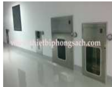
Tủ truyền phòng sạch