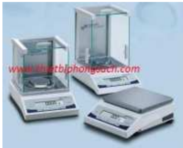
Cân phân tích điện tử