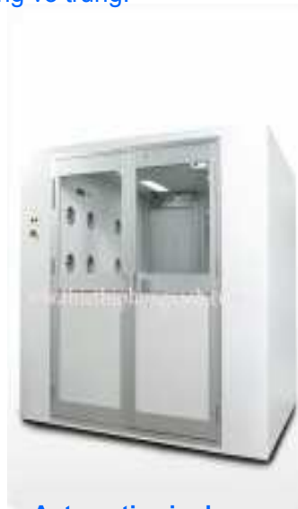
Automatic air shower