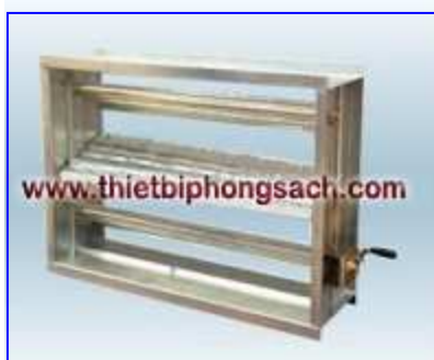
Cửa điều chỉnh không khí