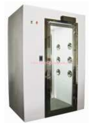
Air shower tự động