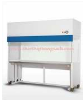
Tủ cấy vô trùng