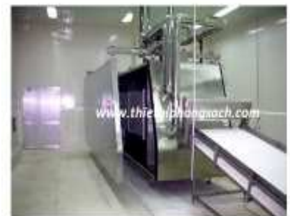
Băng truyền tái đông