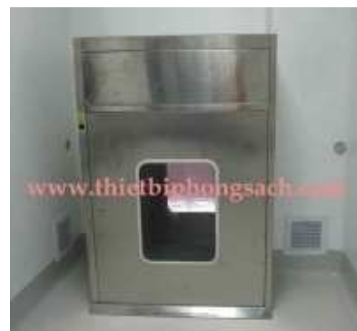
Cửa đưa hàng có thổi khí