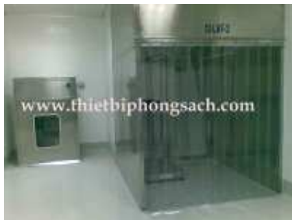
Buồng cân chia mẻ LAF