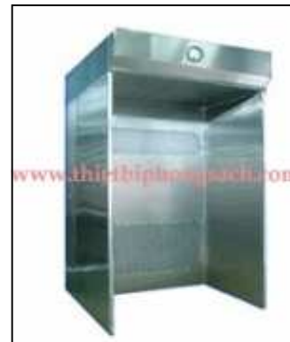
Laminar air flow