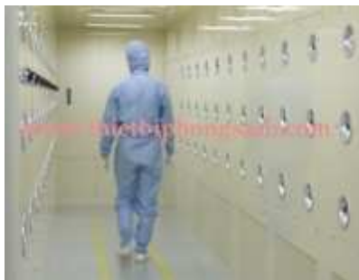
Hành lang tắm khí tự động