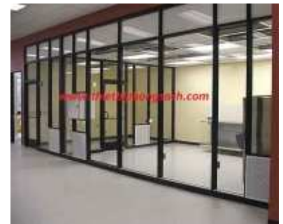
Vách phòng sạch