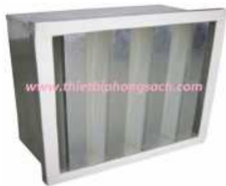
Bộ lọc khí với lượng lớn Hepa V-Bank