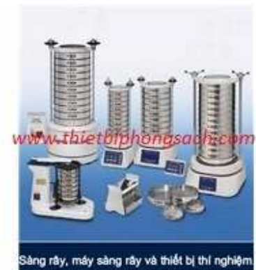
Máy sàng rây