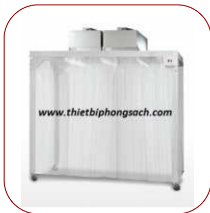
Phòng sạch di động