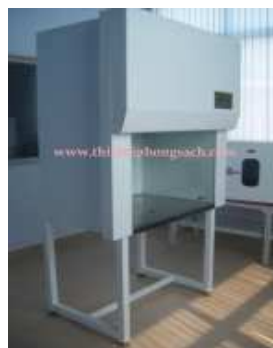
Vertical type clean bench