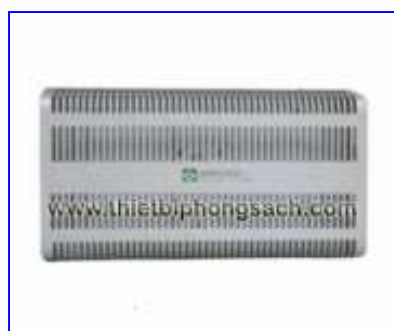
Pressure valve-safety damper