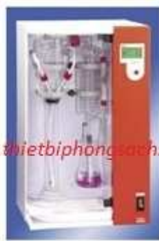
Thiết bị chưng cất đậm tự động