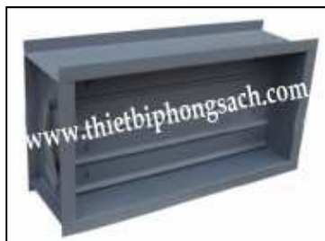
HEPA filter unit