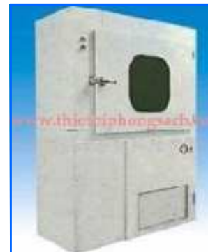
Pass box of air shower