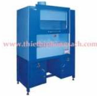
Tủ cấy vi sinh loại thổi đứng

■ Clean bench: Dùng hai lọc HEPA để tạo không khí vô trùng trong buồng làm việc bảo vệ sản phẩm nuôi cấy, đồng thời tạo áp suất âm trước mặt người thao tác để bảo vệ người thao tác tránh lây nhiễm. Ngoài ra tủ còn lọc không khí thải ra để bảo vệ môi trường bên ngoài không bị lây nhiễm, bên trong tủ làm bằng inox, hai hông kính để quan sát. Cửa mở trượt lên xuống, hệ thống tự cân bằng nên cửa có thể dừng tại mọi vị trí hoặc đóng kín hoàn toàn. Có đèn báo hiệu tình trạng làm việc của lọc và khi cần phải thay lọc ( báo chuông và đèn ).