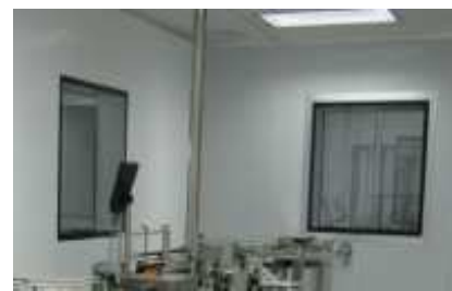
Cửa sổ tiêu âm