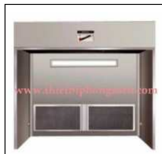
Buồng cân bao bì