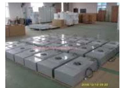
HEPA filter unit