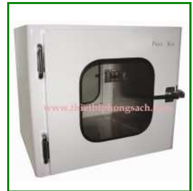
Cửa đưa hàng phòng sạch