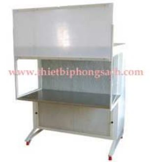
Double horizontal clean bench