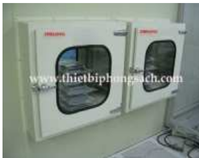
Pass box cửa phòng sạch