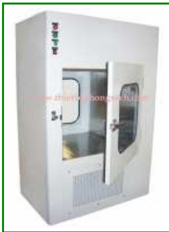
Cửa đưa hàng tiệt trùng