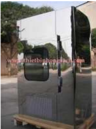
Pass box sạch tiệt trùng

■ Pass Box là một thiết bị không thể thiếu, sử dụng trong các dây chuyền sản xuất sạch, đặc biệt là các nhà máy sản xuất dược phẩm. Pass Box được dùng làm lối vận chuyển vật tư, dụng cụ, bán thành phẩm, thành phẩm giữa các phòng có các cấp độ sạch khác nhau để tránh ô nhiễm chéo. Pass Box được chế tạo với hệ thống khoá tự động và có hai loại đó là Pass Box không có hệ thống tiệt trùng bằng tia cực tím và Pass Box có hệ thống tiệt trùng bằng tia cực tím.