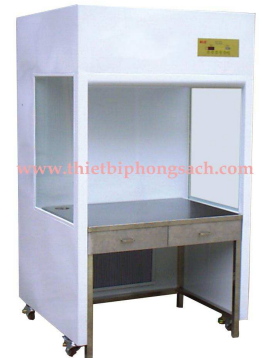
Double Vertical clean bench