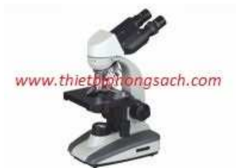
Kính hiển vi