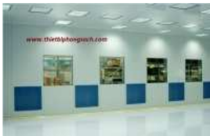
Trần và tường phòng sạch