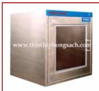
Cửa chuyển hàng phòng sạch