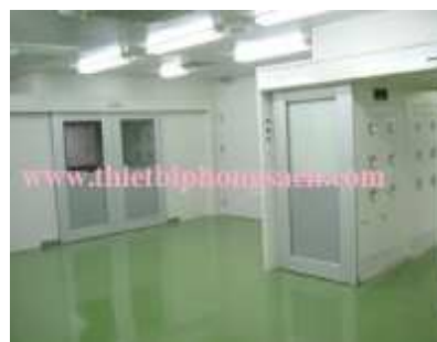
Phòng thổi khí tự động