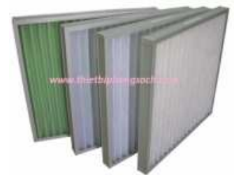
Bảng tiền lọc khung kim loại