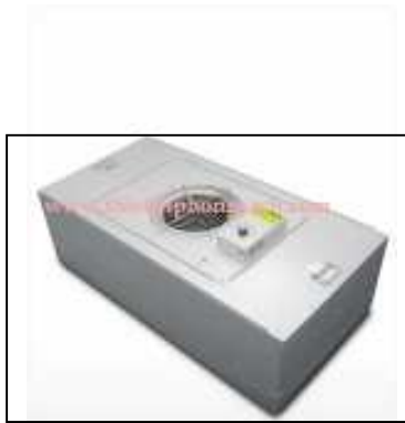
Fan filter unit

■ Air filter gồm các bộ lọc không khí, water filter, oil filter, lọc HEPA, mini-pleat filter, bộ lọc phòng sạch, bộ lọc sơ cấp, trung bình. Bộ lọc không khí là một thiết bị bao gồm các vật liệu sợi để loại bỏ các hạt rắn như bụi, phấn hoa, nấm mốc và vi khuẩn trong không khí. Bộ lọc không khí bao gồm các bộ lọc hóa học hấp thụ hoặc chất xúc tác cho việc loại bỏ các chất gây ô nhiễm không khí phân tử các hợp chất dễ bay hơi như là hữu cơ hay ozone. Bộ lọc không khí được sử dụng trong các ứng dụng mà chất lượng không khí là quan trọng, đặc biệt là trong việc xây dựng hệ thống thông gió và động cơ.