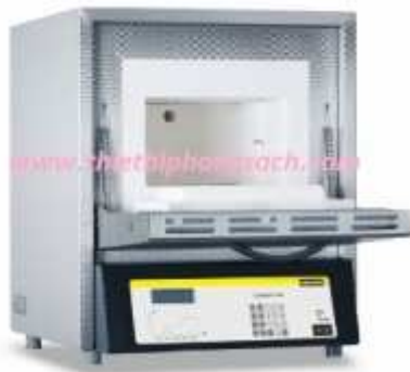
Lò nung chuyên dụng