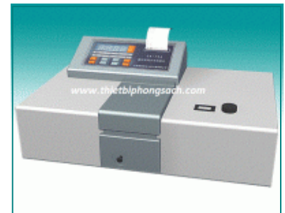
Máy quang phổ