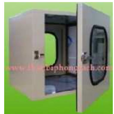
Cửa trung chuyển phòng sạch