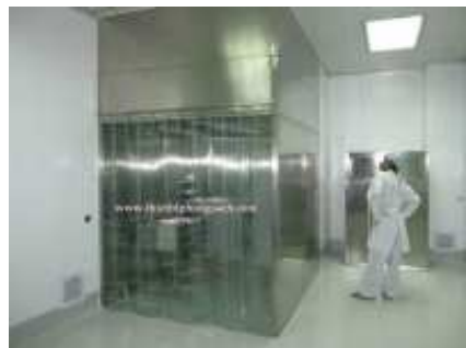
Buồng cân chia mẻ