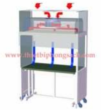
Tủ cấy vi sinh loại thổi ngang