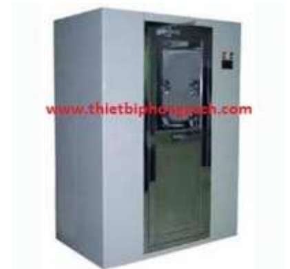
Phòng tắm gió