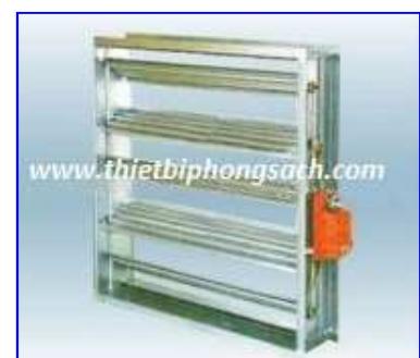
Electric air control valve