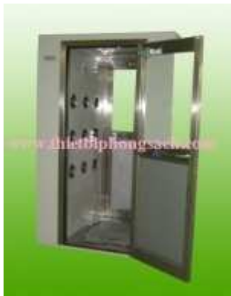
Double sides air shower

■ Air Shower: Sau khi thay quần áo theo quy định trong phòng sạch Locker room, người nhân viên phải đi qua buồng tắm vô trùng. Air shower có trang bị hệ thống vòi phun khí sạch với vận tốc trên 20m/s có tác dụng thổi sạch và thu hồi bụi trên trang phục của người trước khi vào phòng sạch. Air shower có hệ thống interlock (khóa liên động) giữa hai cửa đảm bảo về yêu cầu làm sạch. Khi quạt gió ngừng thổi sau một khoảng thời gian định trước (15 – 45 giây) thì chốt điện sẽ mở cho phép vào phòng vô trùng.