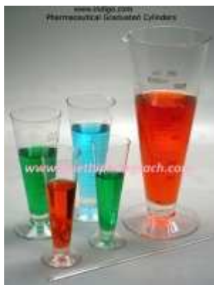
Dụng cụ thí nghiệm